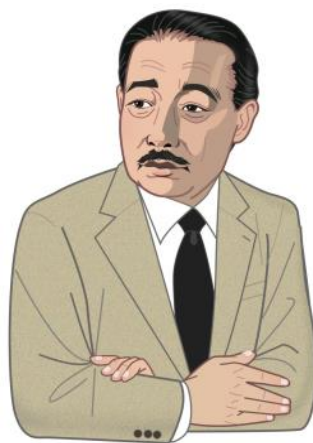
北原白秋 詩人 歌人

北原白秋(本名隆吉)は、現在の福岡県柳川市の商家の二男に生まれ裕福な少年期を過ごしていましたが、明治34(1901)年、16歳の時に、生家と酒蔵が全焼した事により、生活は一変します。19歳で上京し、才能にあふれた詩作で人気絶頂となりますが、人妻との姦通罪で訴えられ名声は傷つけられました。その後知り合った、江口章子と31歳で結婚し、現在の市川市真間の手児奈廟堂そば亀井院で暮らします。居を構えたのは大正5年(1916)年5月から6月のわずかひと月あまりでしたが、真間の暮らしはのどかな雰囲気にもまれ、貧しくても、傷ついた白秋の心を癒したようです。その頃詠んだ歌の一つが『葛飾の真間の継橋夏近し二人わたれりその継橋を』です。