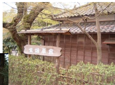
紫烟草舎(里見公園内)

その後、江戸川を渡り小岩に住居を移しました。その時の住居『紫烟草舎』は、昭和45(1960)年に、市川市の里見公園に、当時のまま解体復元されました。白秋と市川との縁は、誠に深いものです。秋の一日、白秋を思い亀井院から手児奈廟堂、里見公園をたどれば、白秋作の童謡を思わず口ずさんでしまうかもしれません。