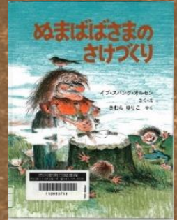
『ぬまばばさまのさけづくり』